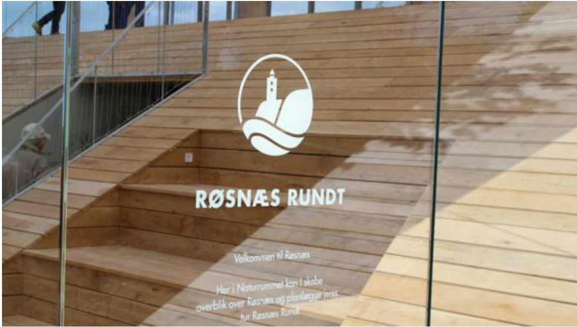
Røsnæs rundt app